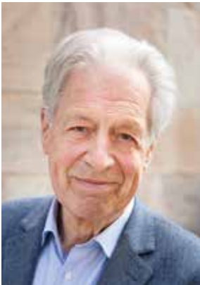
Dr. Henning Scherf

Der Vorstand der Dietmar Schönherr und Luise Scherf-Stiftung für Pan y Arte